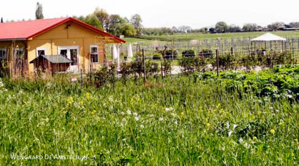
WIJNGAARD DE AMSTELTUIN

Overigens, de bemaling van de Middelpolder en de aangrenzende bovenlanden is nu een complexe aangelegenheid. Er zijn wel 14 verschillende waterniveaus