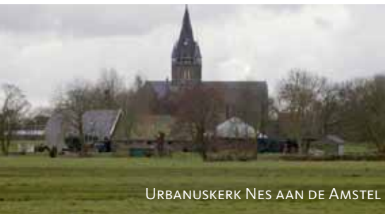
URBANUSKERK NES AAN DE AMSTEL

De Bovenkerkerpolder is een open agrarisch veenweidegebied, onderdeel van het Groene Hart en een Rijksbufferzone. Het gebied heeft middeleeuwse niet afgeveende bovenlanden en 18e-eeuwse droogmakerijen. De polder had een verkavelingspatroon zoals dat nu nog in de Ronde Hoep is te zien. De strook langs de Amstel werd niet verveend. Het meer dat na verveening ontstond was bijna 1.500 ha groot. De drooglegging ervan werd in 1770 voltooid waarna werd begonnen met de inrichting van het nieuwe land. Het uitgangspunt: een zo overzichtelijk mogelijk patroon in verband met maximale exploitatie. Boerderijen werden in de regel gebouwd langs de Amstel, de Ringdijk en Bovenkerkerweg. (P.v.Schaik Cult-hist. w. BP Een eeneiige tweeling 1992 en website BP)